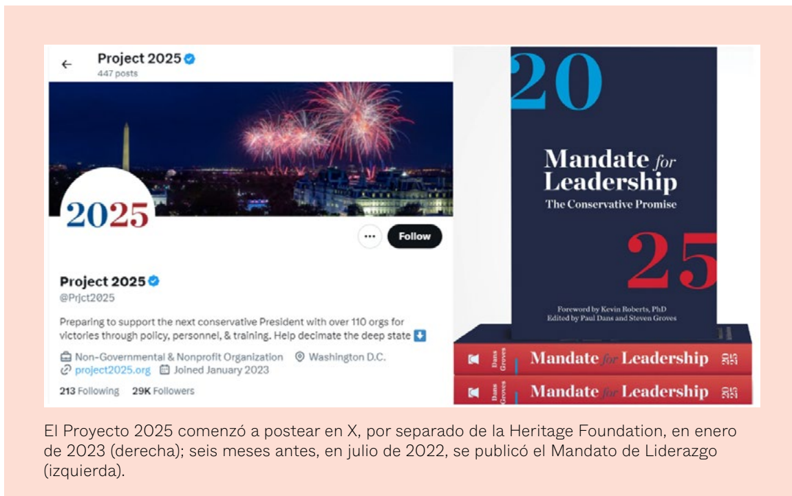
El Proyecto 2025 comenzó a postear en X, por separado de la Heritage Foundation, en enero de 2023 (derecha); seis meses antes, en julio de 2022, se publicó el Mandato de Liderazgo (izquierda).

La agenda de políticas de 920 páginas del Proyecto 2025 es el plan de acción de la Heritage Foundation para un gobierno conservador a partir de 2025. Se basa en una cosmovisión nacionalista cristiana y en narrativas antigénero, ambos elementos clave de la cosmovisión de la extrema derecha dentro y fuera de Estados Unidos. En el Proyecto 2025, el rechazo del término “género” justifica atacar ciertos derechos humanos en Estados Unidos, tales como el derecho al aborto y los derechos de las personas LGBTQ+, así como la amorfa “Izquierda”. Además, el proyecto rechaza la ciencia a la vez que promueve desinformación sobre temas tales como la pandemia del Coronavirus-19, la OMS y la crisis climática. El enfoque del Proyecto 2025 en poner fin al aborto es intransigente e impregna todo el documento, ya que sus autores prometen “ejercer presión a favor de proteger al nonato en cada jurisdicción”, incluso a nivel internacional.